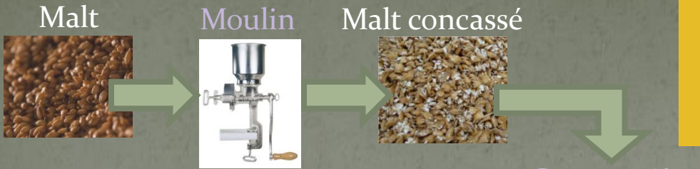
DIAGRAMME SIMPLIFIE DE FABRICATION DE LA BIERE